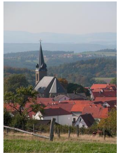
Die Kirche, weithin sichtbares Wahrzeichen.

Heute ist Frankenau als staatlich anerkannter Erholungsort eines der Ferienzentren im Landkreis Waldeck-Frankenberg und Hauptort der seit Anfang der 70er Jahre bestehenden Großgemeinde.