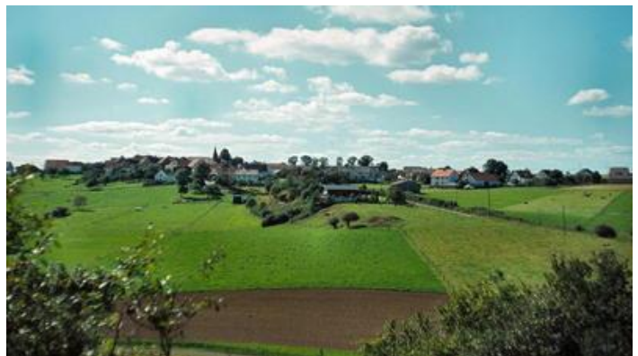
Blick auf Ellershausen.

Ev. Kindergarten Frankenau Ederstraße 2 Tel. 06455 / 8031