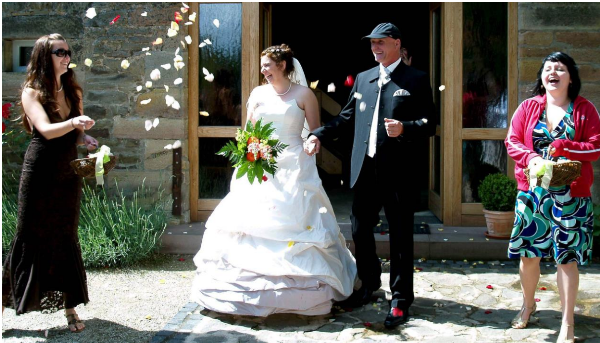
Freudestrahlende Gesichter nach der ersten Eheschließung in der Schulscheune Louisendorf.

Louisendorf ist heute ein landwirtschaftlich ausgerichtetes Dorf. In den 60er und 70er Jahren entstand an der Sommerseite eine Wochenendsiedlung.