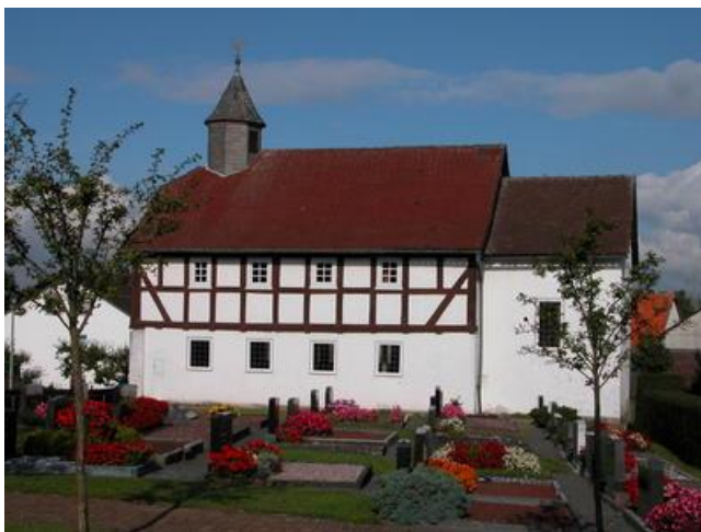
Kirche in Allendorf / Hardtberg.

Evangelischer Kirchenkreis Frankenberg www.kirchenkreis-frankenberg.de