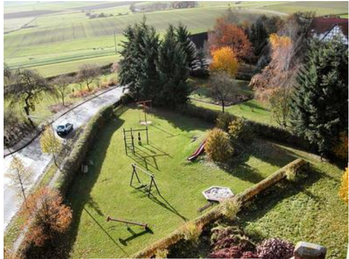
Spielplatz in Ellershausen.