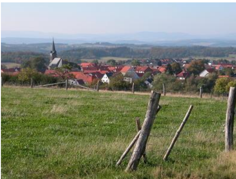
Frankenuau im National- und Naturpark Kellerwald-Edersee.

Flächengröße des Stadtwaldes: ca. 282 ha