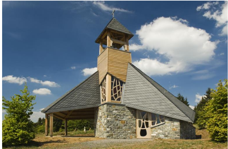
Die neue Quernstkapelle-Frankenau im Nationalpark.

Heute ist Altenlotheim hauptsächlich Wohngemeinde. Einige landwirtschaftliche Betriebe und mehrere Gewerbebetriebe stellen die wirtschaftliche Basis der Gemeinde dar.