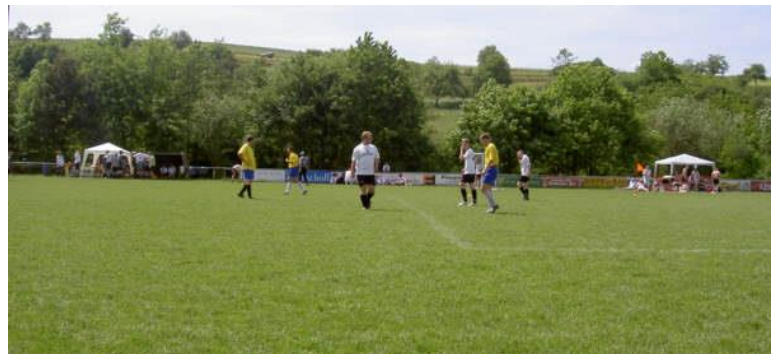
Rasensportplatz in Frankenau.

Ellershausen: Sportplatz, Lengeltalstraße