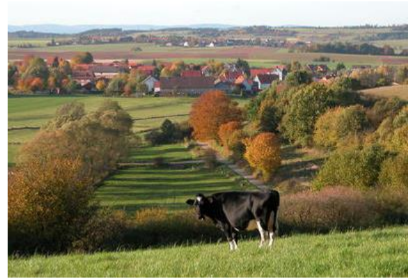
Ansicht von Dainrode.